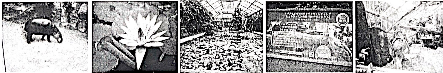
コビトカバ 美しいスイレン スイレン池 ハシビロコウ ネコ科