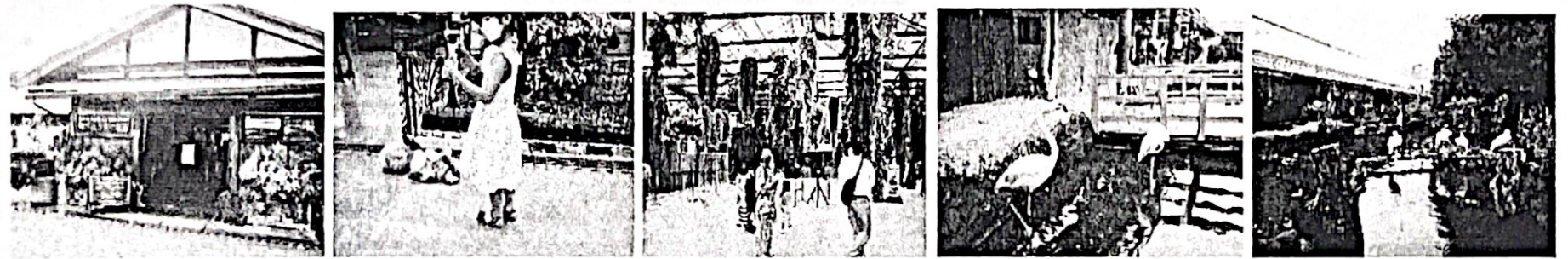
北出入口 動物と触合い場 フラワーシャワー ペリカン 水鳥群

歩行距離：約4km 交通費：1,390円 入国料：1,800円（大人中学生以上） シルバー（満65～）1,300円 ポートライナーと入国料：セット購入、1,800円（計算科学センターの往復乗車券付）+210円（神戸空港—計算科学センター間の精算代）=2,010円、シルバー1,300円+210円=1,510円（集合時に集めます。）