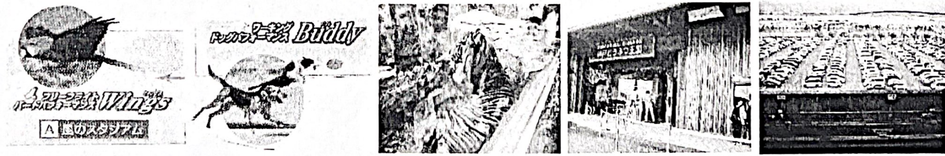
バードフライト ドッグショウ スマトラトラ 南出入口 神戸空港駐車場