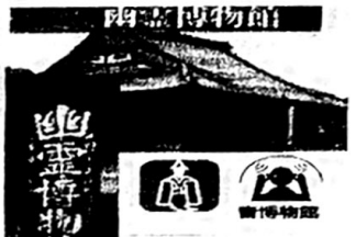
平野上町1-7-26 大念佛寺 開館日 8月4日曜日(9時~16時)

大治2年(1127)に良忍 上人が開いた。融通念佛宗 の総本山。境内に30余りの 堂舎がある。本堂は大坂府 最大の木造建築物